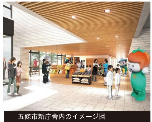
五條市新庁舎内のイメージ図

五條市では、これまで「未来へ継ぐ」をキーワードに市政運営に取り組んでまいりました。今期は主に、県との連携強化によるまちづくりの前進、そして連携をさらにたしかなものへ、市役所庁舎の建て替え、災害に強いまち、陸上自衛隊の誘致をはじめさまざまな施策を進めてきました。またリニア中央新幹線の中間駅から関空を結ぶルートにおいて、五條市に新駅の構想が描かれるなど、ハード、ソフトともに五條市は力強く前進しています。